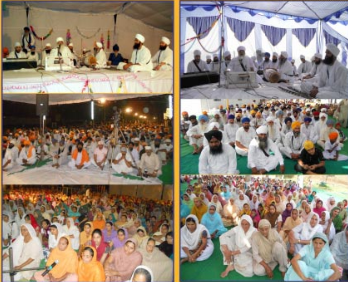
ਜਾਂਗਲਾ ਅਤੇ ਖਤੀਬ (ਨੇੜੇ ਬਟਾਲਾ) ਵਿਖੇ ਕੀਰਤਨ ਸਮਾਗਮ ਦੌਰਾਨ ਸੰਗਤਾਂ ਅਤੇ ਬਾਬਾ ਜੀ

ਕਲੋਸ਼ ਮਨ ਦੀ ਹੀ ਇਕ ਵਿਅਰਥ ਕਲਪਨਾ ਹੈ ਪਰ ਦੋਨੋਂ ਗਿਆਨ ਦੇ ਹੁੰਦਿਆਂ, ਰਾਗ ਅਤੇ ਦ੍ਰੋਹ ਦੇ ਕਲੋਸ਼ ਦੇ ਕਾਰਨ ਸਰੀਰ ਵਿਚ ਹੀ ਆਤਮ ਅਧਿਆਸ ਹੋ ਜਾਂਦਿਆਂ ਕਰਦਾ ਹੈ। ਮੁਰਖ ਤੋਂ ਲੈ ਕੇ ਪੁਸਤਕਾਂ ਪੜ੍ਹ ਕੇ ਹੋਏ ਵਿਦਵਾਨ, ਆਪਣੇ ਵਾਸਤਵਿਕ ਆਤਮ ਸਰੂਪ ਨੂੰ ਭੁੱਲ ਕੇ ਭੌਤਿਕ (ਪ੍ਰਾਕ੍ਰਿਤਕ) ਸਰੀਰ ਦੀ ਰਖਸ਼ਾ ਵਿਚ, ਪਾਲਣਾ-ਪੋਸ਼ਣ ਵਿਚ ਹਰ ਸਮੇਂ ਲੱਗੇ ਰਹਿੰਦੇ ਹਨ ਅਤੇ ਇਸਦੇ ਨਾਸ਼ ਹੋਣ ਤੋਂ ਘਬਰਾਉਂਦੇ ਰਹਿੰਦੇ ਹਨ। ਇਸ ਤਰ੍ਹਾਂ ਇਸ ਮਿਤ੍ਰ ਦੇ ਭੇਂਦੇ ਜੋ ਸੰਸਕਾਰ ਚਿਤ ਵਿਚ ਪੈ ਜਾਂਦੇ ਹਨ, ਇਨ੍ਹਾਂ ਸੰਸਕਾਰਾਂ ਰਾਹੀਂ ਘਬਰਾਹਟ ਪੈਦਾ ਹੋ ਕੇ ਚਿਤ ਦੁਖੀ ਰਹਿੰਦਾ ਹੈ। ਦੋਸੇ ਅਵਸਥਾ ਨੂੰ ਅਭਿਨਿਵੇਸ਼ ਕਲੋਸ਼ ਕਹਿੰਦੇ ਹਨ। ਇਹ ਅਭਿਨਿਵੇਸ਼ ਕਲੋਸ਼ ਹੀ ਸੁਕਾਮ ਕਰਮਾਂ ਦਾ ਕਾਰਨ ਹੈ ਜਿਨ੍ਹਾਂ ਦੀਆਂ ਵਾਸ਼ਨਾਵਾਂ ਚਿਤ