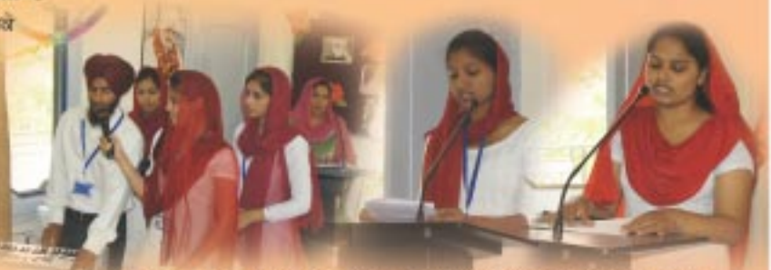
ਡੀ ਐਫ ਕਾਲਜ ਚਰਵਾਣਾ ਸਾਹਿਬ ਦੇ ਵਿਦਿਆਰਥੀ ਸੰਤਰੇ ਸਨਾਂਨਾ ਇਲਾਮ ਵੰਡ ਸਮਾਵੇਹ ਦੌਰਾਨ ਸ਼ਬਦ ਕੀਰਤਨ ਅਤੇ ਲੈਕਚਰ ਵਿੱਚੇ ਹੋਏ।

ਤਿੰਨਾਂ ਗੁਣਾਂ ਦਾ ਕੁਦਰਤੀ ਸੁਭਾਵ ਫਿਨ-ਫਿਨ ਕਰਕੇ ਬਦਲਦੇ ਰਹਿੰਦਾ ਹੈ। ਮਨੁੱਖੀ ਚਿਤ, ਤਿੰਨ ਗੁਣਾਂ ਸਹਿਤ ਜੜ੍ਹ ਹੈ ਜਿਸ ਵਿਚ ਈਸ਼ਵਰੀ ਚਿਤ ਦਾ ਪ੍ਰਤੀਬਿੰਬ ਪੈਣ ਕਰਕੇ ਵਖਰਾ-ਪਨ ਦਾ ਅਹਿਸਾਸ ਹੋ ਰਿਹਾ ਹੈ, ਅਵਿਦਿਆ ਕਰਕੇ ਆਤਮਾ ਤੋਂ ਜੀਵ-ਆਤਮਾ ਭਿੰਨ-ਭਿੰਨ ਪ੍ਰਤੀਤ ਹੋ ਰਹੇ ਹਨ ਜਿਵੇਂ ਲੱਖਾਂ ਪਾਣੀ ਦੇ ਬਰਤਨਾਂ ਵਿਚ ਇਕੋ ਚੰਦਰਮਾ ਦਾ ਪ੍ਰਤੀਬਿੰਬ ਪੈਣ ਕਰਕੇ ਹਰ ਬਰਤਨ ਵਿਚ ਅਨੇਕਤਾ ਦਾ ਪ੍ਰਭਾਵ ਪੈ ਰਿਹਾ ਹੈ ਅਤੇ ਜੜ੍ਹ ਚਿਤ ਅਤੇ ਚੇਤਨ ਪੁਰਸ਼ ਵਿਚ, ਫੇਦ ਗਿਆਨ ਦਾ ਹੋ ਜਾਣਾ, ਅਸਿਮਤਾ ਕਲੋਸ਼